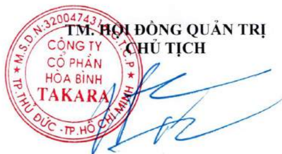
TRẦN CÔNG THÀNH